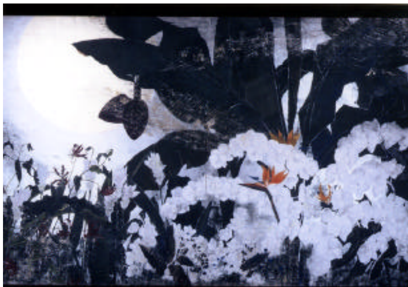
万華鏡（227cm x 145cm）